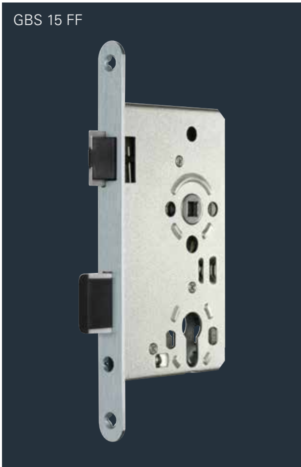
GBS 15 FF