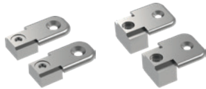
BE IS 12